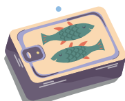
Olej z ryb